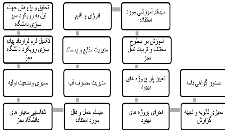
شکل ۲- شرایط بعد از حصول IFR

قدم ۳-۳: تمام عناصر اعلام شده در مرحله ۲-۳- الف باید در تصویر باشند. اگر عنصری در قدم ۲-۵ انتخاب شده باشد، باید در بخش تصویر مطلوب نشان داده شود.