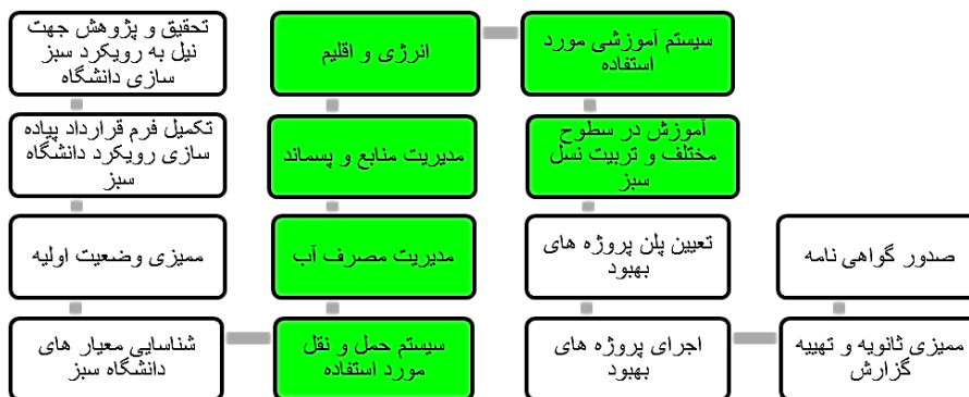
شکل ۳- عوامل IFR که تغییر آن ها اهمیت دارد

الف: در تصویر مطلوب عنصر مشخص شده در ۳-۱- الف را پیدا کنید و آن را برجسته نشان دهید (با یک رنگ متفاوت یا وسایل دیگر)، یعنی آن قسمتی که باید عملکرد لازم را تحت شرایط لازم انجام دهد.